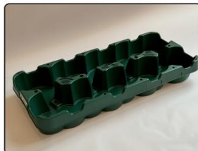
EPT 200 (6/CC Layer)

8 – 10 x 10,5-13 cm GTIN 4262480837750 GRAI 800304262480837750XXXXXXXXX