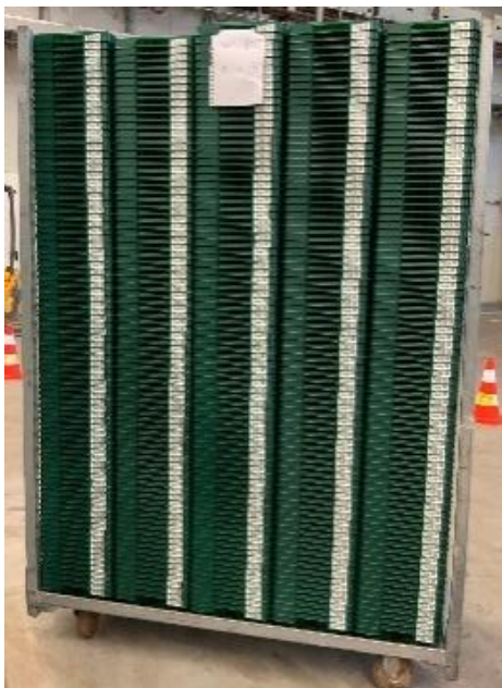
EPT 400 auf dem CC Container ohne Bretter Mindestens oben einmal mit Folie absichern

Eigene Etiketten und Preisauszeichnungen sollten so weit wie möglich vermieden werden, dürfen aber auf keinen Fall auf die EPT Etiketten geklebt werden. Sollten eigene Etiketten genutzt werden, ist auf die rückstandslose einfache Entfernung des Klebers zu achten. Vor Einlieferung in einem EPT Depot sind Aufkleber und Etiketten so weit wie möglich zu entfernen.