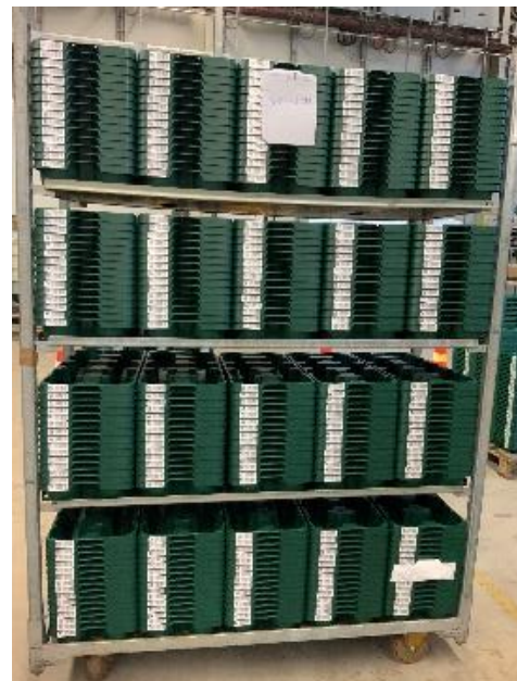
EPT 400 auf dem CC Container mit Brettern Eine zusätzliche Ladungssicherung ist nicht zwingend notwendig